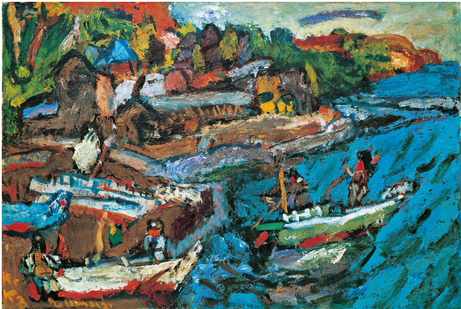
中川一政《湯ヶ原の海と山(漁船帰ル時)》昭和26-27年(1951-52) 油彩・カンヴァス 真鶴町立中川一政美術館蔵