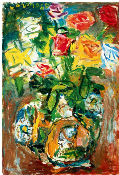
中川一政《薔薇》昭和62年(1987) 油彩・カンヴァス 真鶴町立中川一政美術館 蔵