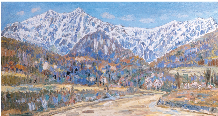
小林和作《雪の山の春》昭和40年(1965) 油彩・カンヴァス ひろしま美術館 蔵

本展は、当館の小林和作コレクションと共に真鶴町立中川一政美術館の作品を中心に約90点で構成されます。それぞれがアトリエを構えた尾道と真鶴は、「坂のまち」としても知られています。坂道を歩き街の人々に愛された二人の多彩な芸術の歩みをご紹介します。