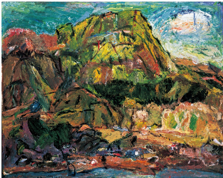
中川一政《駒ヶ岳》昭和55年(1980) 油彩・カンヴァス 真鶴町立中川一政美術館 蔵